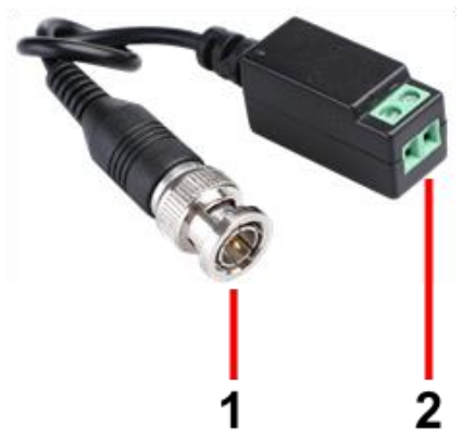
Рис. 2 Приемопередатчики TP-H/1, TP-H/2, разъемы